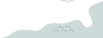
LAGE AM GRUNDSTÜCK