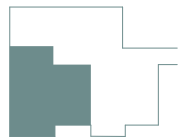
LAGE IM GESCHOSS